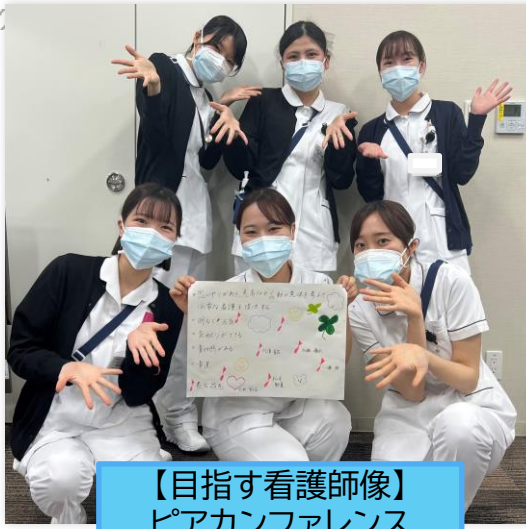
【目指す看護師像】 ピアカンファレンス