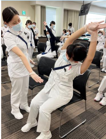
【動作法】 カラダとココロを整えるために