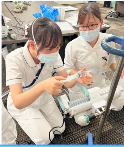
【技術演習】輸液ポンプ・ シリンジポンプの管理