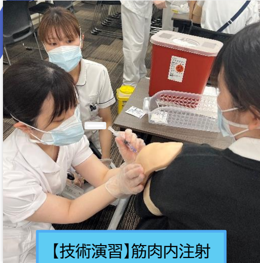
【技術演習】筋肉内注射