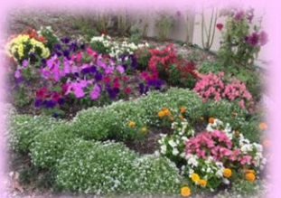
図書室からは綺麗な 花壇も見えます