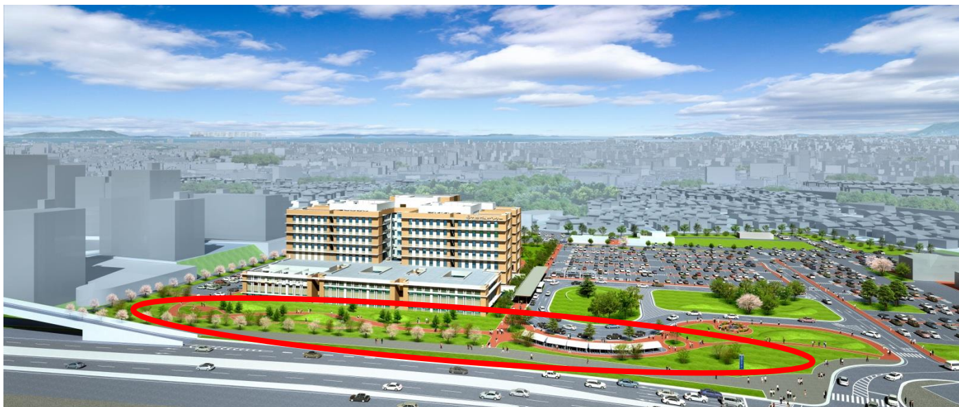
朱書きの部分が「陽だまりの径」

お時間がありましたら、庭園内を散策いただき、四季の移ろいを感じられては如何でしょうか。