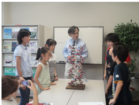
DNA 模型を前にしての討論

ニアからの関心も高く、例年、新聞各紙より取材を受け、記事が掲載されています。がん専門病院のめずらしい取り組みとして、子供たちの科学への関心を刺激する試みとして、注目されているようです。