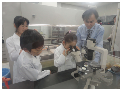
がん細胞を観察する子供たち

き物なのか、その根幹である遺伝子とゲノムにさかのぼって考えることも大切ではないでしょうか。また、子供たちが、がん細胞や遺伝子の実態であるDNAを実際に目で見、手で触れてみることも必要ではないでしょうか。当院は研究所を併設しており、長いがん研究の歴史をもちます。そこで2011年にはじめての取り組みとして、がんの専門病院ならではの、市民のための「がん」と遺伝子」講習会を開催しましたところ、大変ご好評をいただきました。