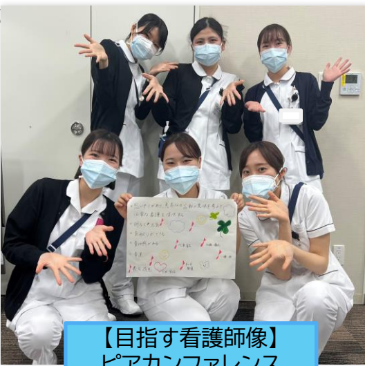
【目指す看護師像】 ピアカンファレンス